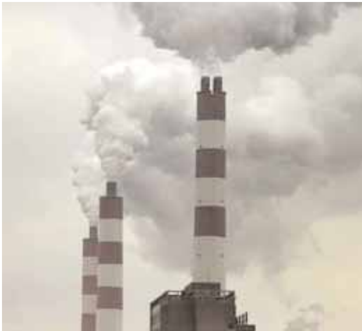
Οι ΗΠΑ είναι η δεύτερη χώρα σε εκπομπή αερίων του θερμοκηπίου μετά την Κίνα

Ο Μπαράκ Ομπάμα έχει δηλώσει πάντως ότι η σύνοδος θα πρέπει να καταλήξει σε μια συμφωνία «με άμεση λειτουργική εφαρμογή», και όχι σε μια απλή πολιτική διακήρυξη.